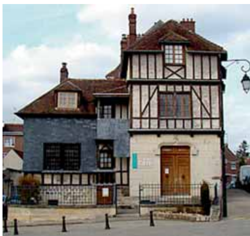
MUSÉE CALVIN - NOYON

Puisque l'année 2009 est celle du 500 ème anniversaire de la naissance de Jean Calvin, c'est l'occasion de porter une attention particulière à la cohérence de sa pensée théologique : une architecture dont la pièce maîtresse est le thème de la souveraineté de Dieu. Dieu est Dieu, tout simple-